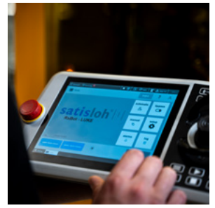
直观且方便使用的移动面板