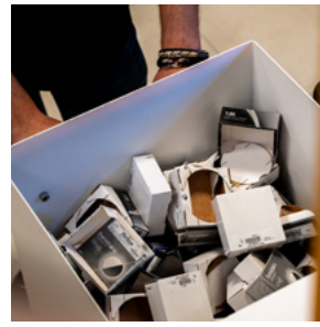
自动将废弃物分类放到独立的垃圾箱中, 方便回收