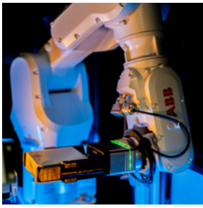
快速高效地处理镜片盒子