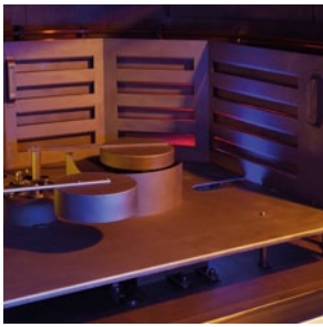
Intelligente bewegliche Blenden