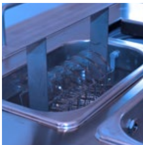
Processo semi-automatizado de limpeza e secagem Hydra-sonic-5