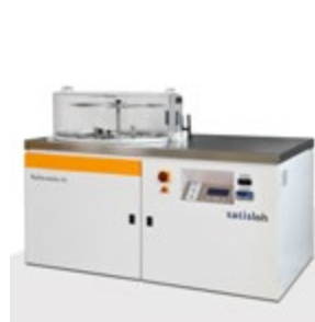
Sistema compacto "conecte e lave" Hydra-sonic-10