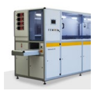
Sistema de limpeza ultrassônico totalmente automatizado Hydra-sonic-40