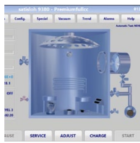
界面友好的人机交互软件，可连接车房4.0系统